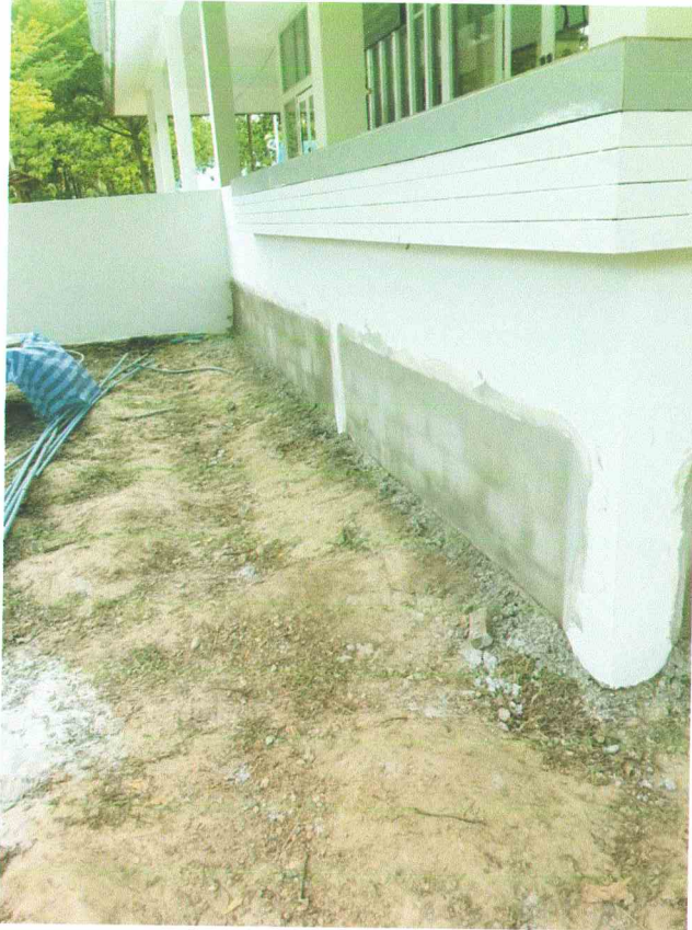
ด้านซ้าย